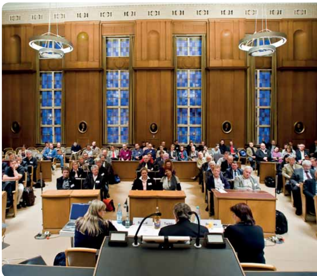
Gespannte Aufmerksamkeit im Saal der Bezirksverordnetenversammlung.