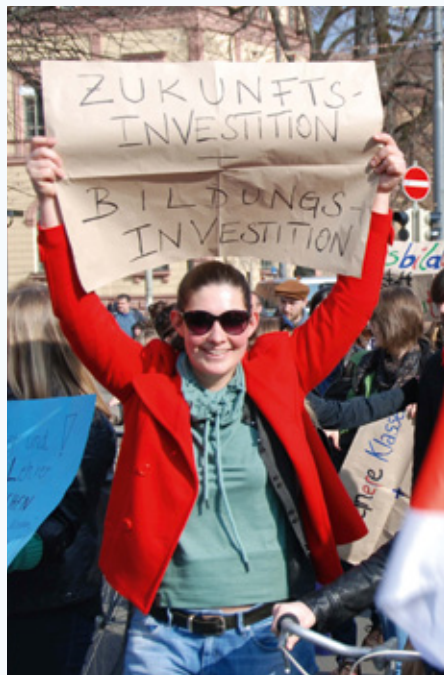
Für eine gute Zukunft mittels guter Bildung: Demonstration am 8. März in München.